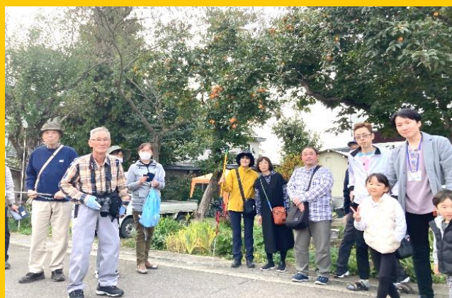
『横手柿ウォッチ』の様子

また、横手川の源流域・三又地域が舞台の映画『山内三又』が完成し、十文字映画祭等で上映します。城下町のバックヤードとして水、薪炭、山の幸を供給してきた山間地から、秋田を、東北を日本を問う、そんな大それたことにも取り組んでいます。