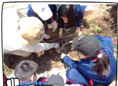
ホップの株ごしらえに挑戦!