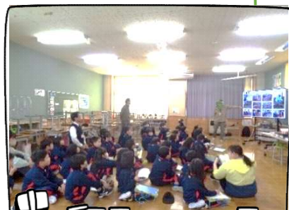
ホップの歴史や特徴を学びました

作業を終えた児童たちは、「両手を広げたくらい大きくなってほしい」「茎を掘ることが難しかったけど、最後は上手にできた」と、早くも自分たちが育てるホップに愛着を感じているようでした。