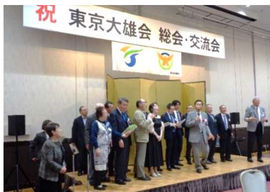
「ふるさと」を合唱し再開を約束