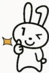
マイナンバーカードの取得率

まだまだ窓口でのカード作成を受け付けています。多少の空き時間で申請できますので、電話予約の上、ご来庁ください。