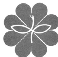
民生児童委員のシンボルマーク