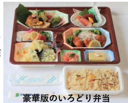
豪華版のいろいろ弁当