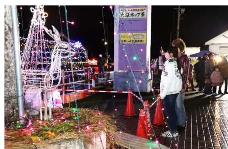
点灯イベントでイルミネーションの灯りを楽しむ来場者の皆さん