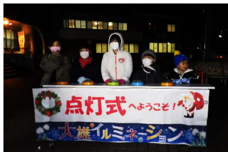
カウントダウンに合わせて点灯スイッチを押してくれた子どもたち