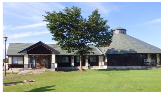
大雄交流研修館「ふれあいホール」

なお、ふれあいホールはこれまでどおり事前に予約することで、交流室や研修室（和室）、調理実習室などを利用することができます。