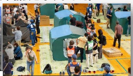
避難住民による避難所開設