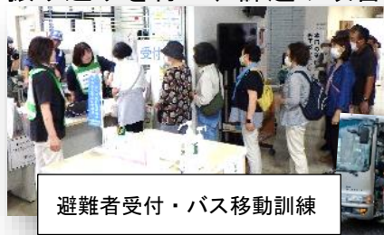
避難者受付・バス移動訓練

8月30日、「地震発生に伴う各機関の初動対応及び住民の避難・避難所開設」を訓練テーマに横手市総合防災訓練を実施しました。駅前区、相野々区の住民を対象に地元消防団、防災士や関係機関・企業など190人あまりが参加。避難住民による避難所開設や災害応援協定を締結している企業による物資の搬送などの訓練が行われました。訓練終了後には参加者全員での振り返りを行い、課題や改善点などを共有し、防災意識を高め合う機会となりました。