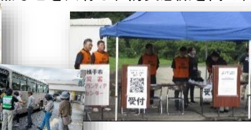
災害ボランティアセンター開設