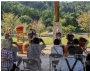
御嶽清流太鼓の演奏 (大松川ダム公園)

生涯学習館 Ao-na のほか、秋田自動車道山内トンネル工事現場や大松川ダムの視察、そば打ち体験など趣向を凝らした日程を満喫し、普段は見られない施設を見学できた、初体験のそば打ちが楽しかったなどと大好評でした。参加者は同郷の今と昔を語る良い交流機会となり、次回再会を楽しみに帰路に着きました。