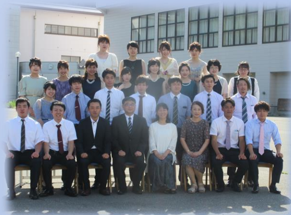
旧山内中学校校舎前にて記念撮影

成人式を終え、令和最初の新成人の皆さんは、新しい時代を担う決意と感謝の気持ちを胸に、大人の一歩を踏み出しました。