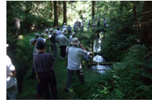
後三年合戦の顕彰

市内北部及び西部地域は後三年合戦の舞台とされ、遅くとも江戸時代には源氏中興の祖とされる源義家が活躍した後三年合戦に関する史跡や伝承地が保護継承されてきた。こうした史跡は近代以降も地域住民の顕彰対象となり、大鳥井山遺跡や陣館遺跡などの関連史跡や金澤八幡宮などの伝承地の顕彰が行われ、歴史的風致を形成している。