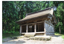
波宇志別神社神楽殿