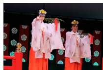
子ども伝統芸能発表大会