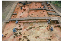
後三年合戦関連遺跡群の発掘調査