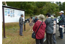
史跡・地域探訪による活動後継者の育成