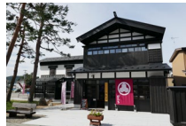
増田地区街なみ環境整備事業（生活環境施設）