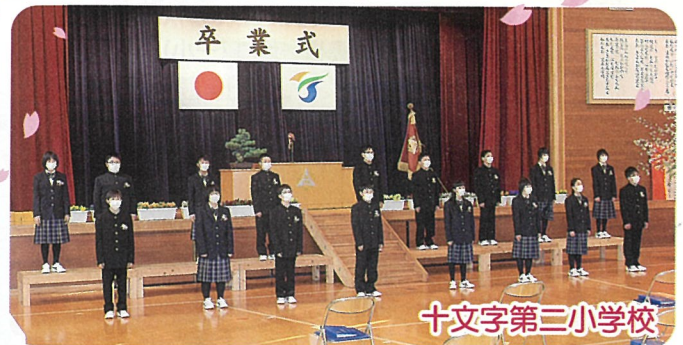
十文字第三小学校