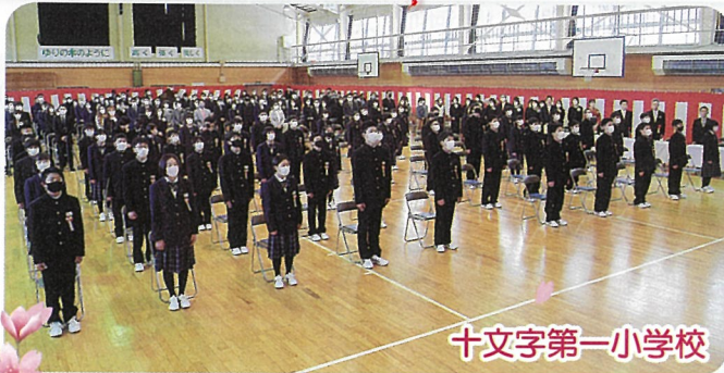
十文字第一小学校