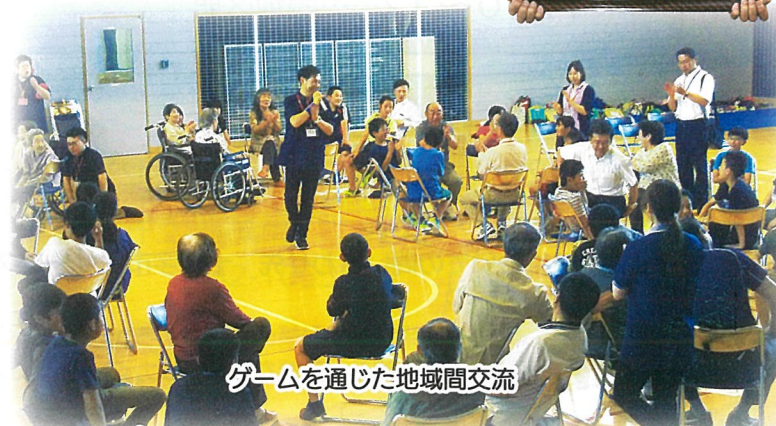
ゲームを通じた地域間交流