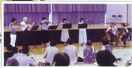
アンサンブルリベラの演奏

本物のボーリングより小ぶりのボールとピンを使って行うスマイルボーリングは、子どもからお年寄りまで楽しめる新しいスポーツです。西地区館多目的ホールで行われたイベントには、地域の皆さんにたくさんお出でいただきました。運動で汗を流した後は、みんなで朝食をいただき、引き続き、「アンサンブル・リベラ」の演奏と「おはなしぼぼボ」の読み聞かせを楽しみました。