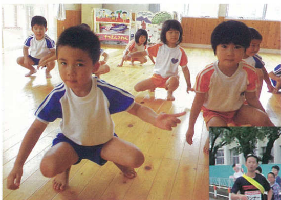
認定こども園こひつじのリズム運動