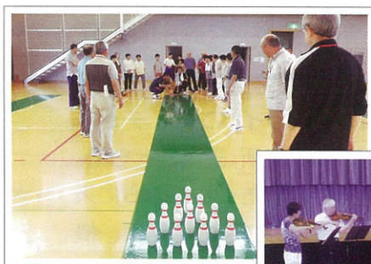
スマイルボーリング