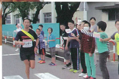
第一小学校前を通過するチャレンジラン

15分以上運動をした人の参加率を競うイベント、チャレンジデーが開催されました。地域内の保育所、認定こども園、小中学校、企業などのご協力をいただき、たくさんの方にスポーツを楽しんでいただきました。皆様のご協力の結果、横手市は全国平均54.3%を大きく上回り、昨年を超え、過去最高となる88.5%の参加率を達成しました。ただ、対戦相手の鹿児島県霧島市は、全国1位となる90.1%の参加率を達成し、残念ながら勝負には負けてしまいました。横手市全地域が参加してからの通算成績は、これで2勝2敗となりました。