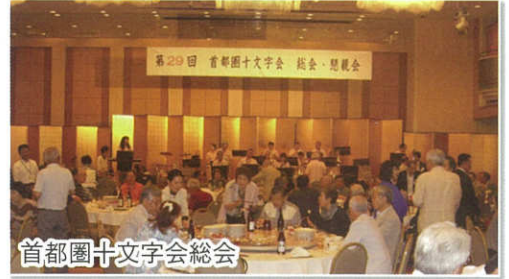
首都圏十文字会総会

初参加となった首都圏十文字会総会。若干世代が偏っていましたが、たくさんの参加者が懇親を深めていました。ロビーで一息ついていたら、年配の方から関東訛りの秋田弁で「十文字のごと頼むな」と言われたのが非常に印象深く、出身者の故郷への思い、在住者の責任のようなものを感じました。次回も色々とお話を伺いたいものです。