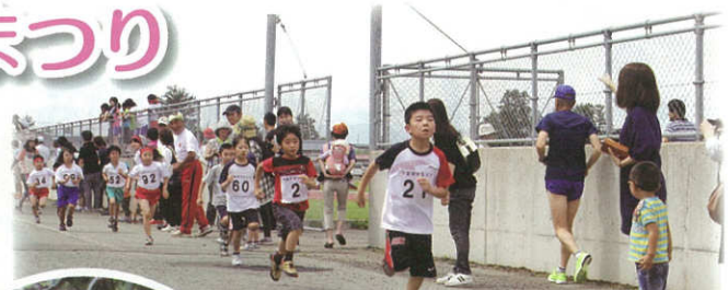
第56回十文字マラソン大会兼 第29回十文字さくらんぼマラソン大会