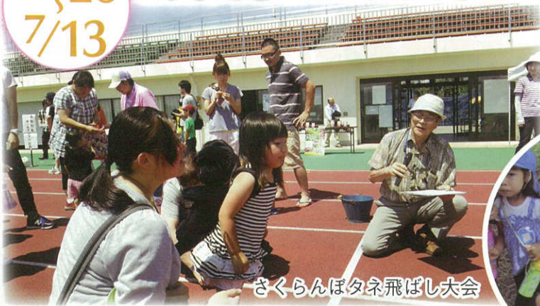
さくらんぼタネ飛ばし大会