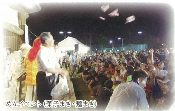
めんイベント (菓子まき・麺まき)