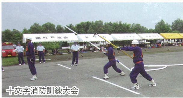
十文字消防訓練大会

約20年ぶりの開催 となった左馬の虫追 い祭り。松明を持 った子ども達が集 落を回った後、ア カシアの木とワラ で作られたババエ ヨに火が放たれる と大きな歓声があ がりました。