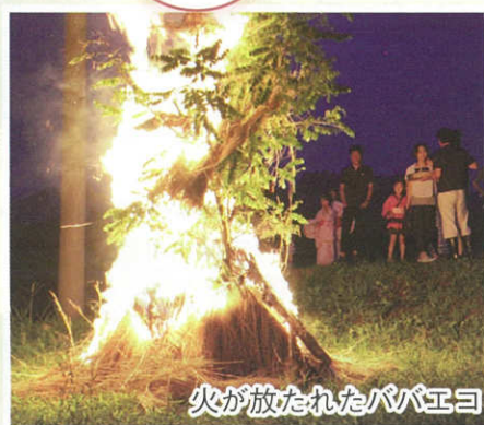
火が放たれたババエヨ

約20年ぶりの開催 となった左馬の虫追 い祭り。松明を持 った子ども達が集 落を回った後、ア カシアの木とワラ で作られたババエ ヨに火が放たれる と大きな歓声があ がりました。