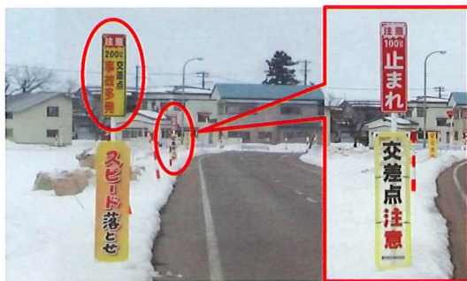
【交通安全啓発看板の設置】(柏木)