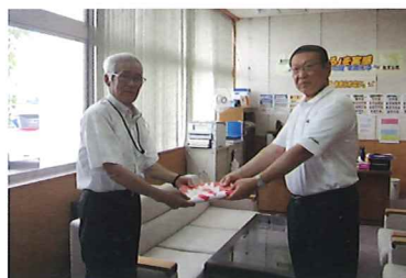
【危険箇所表示旗の設置】