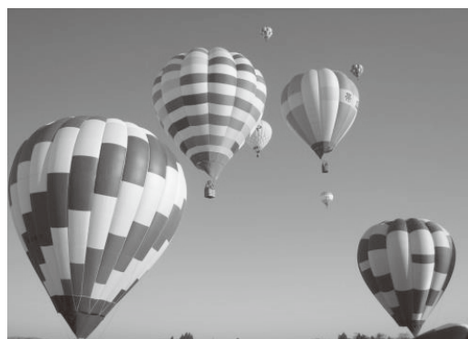
▲秋田スカイフェスタでの熱気球

国内外からの観光客の二次交通の利便性を図るため、よこてWARPの運行を継続しつつ、事業収益性を高めるなど、事業化に向けた第2期実証実験を実施します。