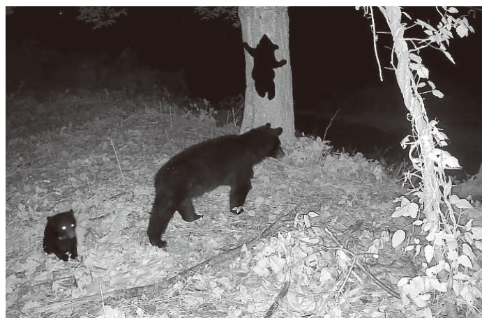
▲出没したクマ (センサーカメラによる撮影)

クマなどの有害鳥獣の捕獲や出没対応など、鳥獣被害対策実施隊による被害防止活動を行います。また、害獣による農作物等被害防止のための電気柵の設置、クマを誘引する恐れのある栗や柿などの木の伐採に係る経費、鳥獣被害対策実施隊員を育成し確保するため、狩猟免許などの新規取得や散弾銃などの購入に係る経費について支援します。