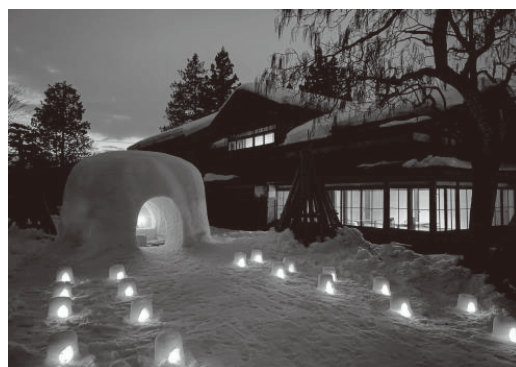
▲旧片野家住宅のかまくら