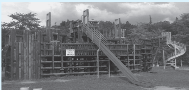
改修予定の横手公園遊具