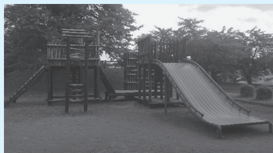
改修予定の八王寺公園遊具