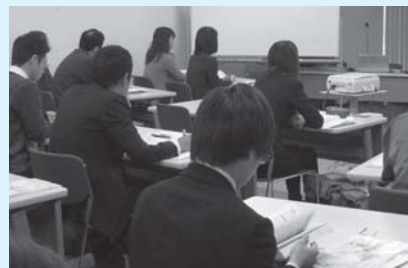
中小企業人材育成支援事業を活用した研修

地域未来投資促進法に基づく地域経済牽引事業計画の承認を受けた市内中小企業が実施する経済波及効果の高い事業を強力に支援し、産業振興による地域経済の活性化と雇用の創出を図ります。