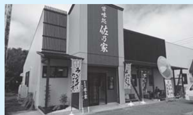
空き店舗等利活用支援事業 を活用して整備した店舗

市内の商業活性化を目的に、商工団体への支援や販促活動への補助、空き店舗を活用した事業への支援を実施します。