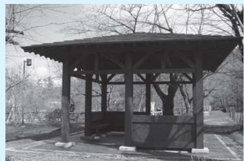
長寿命化対策事業で改修したあすまや

都市公園及び市立公園等の遊具の安全や公園内の事故等を防止するため、維持管理をおこないます。