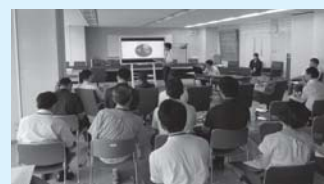
インターンシップ促進支援事業

新型コロナウイルス感染症の影響により、雇用する労働者を一時的に休業させた事業主に対し、労働者に支払った休業手当の一部を助成します。