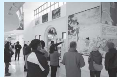
ボランティアガイド等養成講座の様子

「横手市増田まんが美術館を中核とした地域資産活用地域計画」に基づき、マンガ文化の魅力で観光客の市内周遊を促す取り組みを行い、滞在時間の延長、宿泊客の増化、観光消費の拡大を目指します。