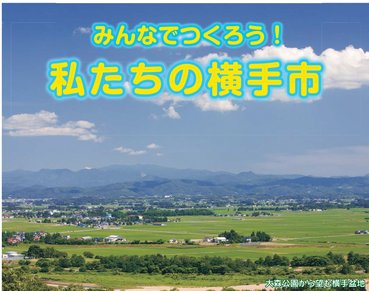
大森公園から望む横手盆地