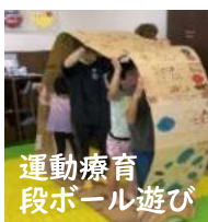
運動療育 段ボール遊び