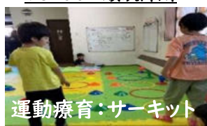
運動療育:サーキット