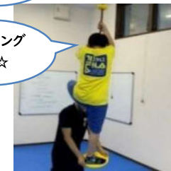
クライミング ロープ☆