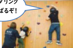
ボルダリング がんばるぞ!