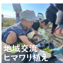
地域交流 ヒマワリ植え

10:00 来所:手洗い等～静かな活動 10:30 準備運動・運動活動 12:00 昼食～自由遊び 13:30 運動活動・外出支援 15:15 おやつ～静かな活動 16:00 順次降所