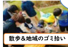
散歩&地域のゴミ拾い