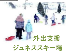
外出支援 ジュネススキー場