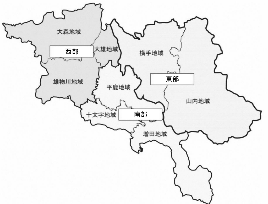
図表 25 本市の日常生活圏域

本市では、これまでの体制を踏襲し、東部、西部、南部の3圏域を日常生活圏域として定め、各圏域の地域特性に合わせた取り組みを推進します。