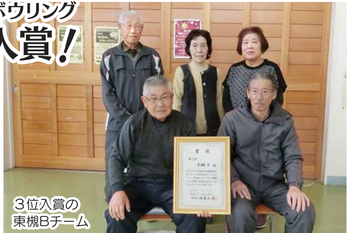
3位入賞の東槻Bチーム

この後1月から3月まで、スマイルボウリングの大会が続きます。今からでも練習に参加して、大会に出場してみませんか?