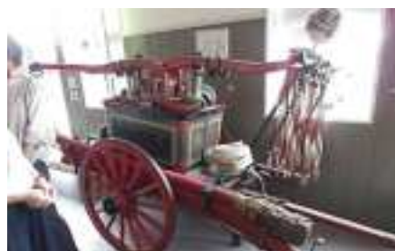
大正・昭和時代の碗用ポン