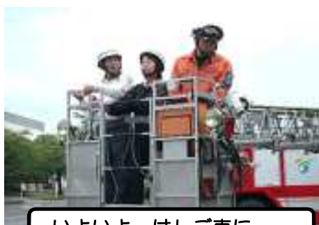
いよいよ、はしご車に・・・