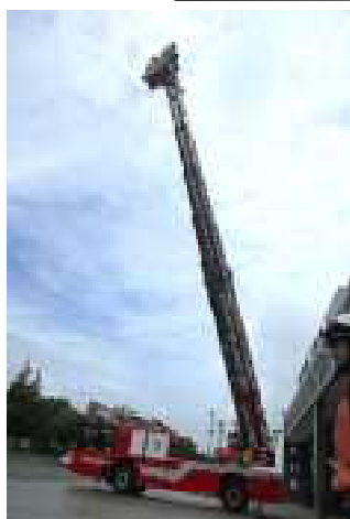
最長35メートル上昇！