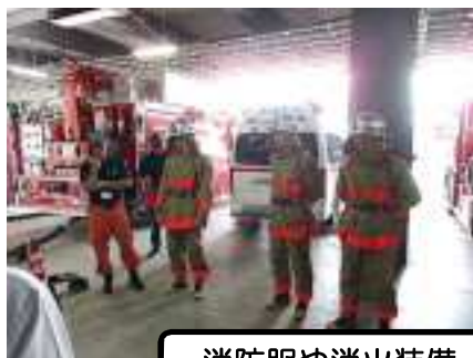
消防服や消火装備、車両の内部も見学