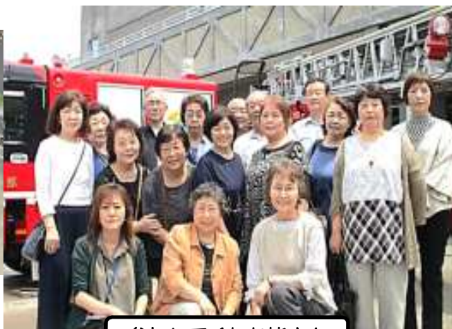
参加してくれた皆さん