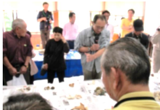
← 林学基礎講座の様子

参加した方からは、「色々なキノコがあり、勉強になった」「今後また参加したい」との声が聞かれました。