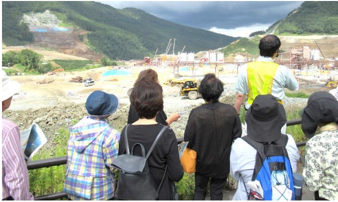
ダム展望台からの説明の様子