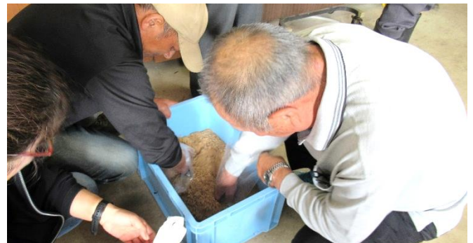
菌床づくりの様子↓