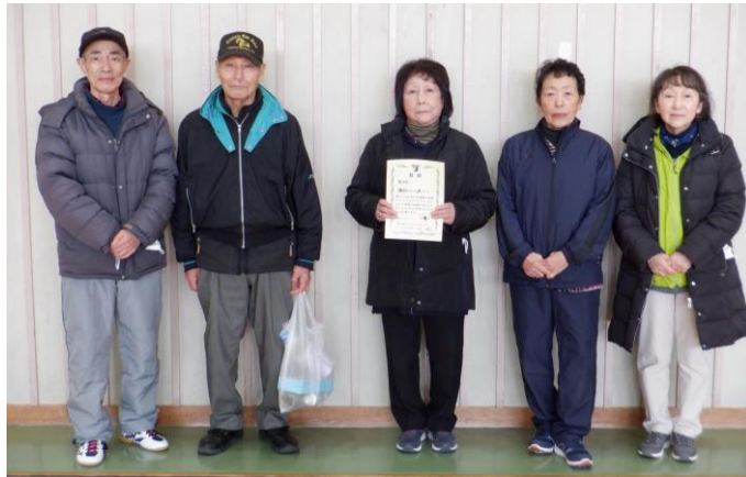
館合にここ A チーム