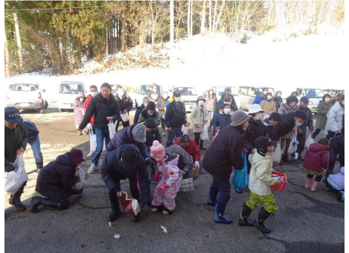
毎年恒例の餅まきにも沢山の方が来てくれました。