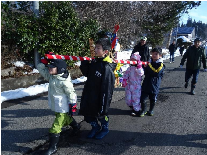
仁王門へ梵天を奉納に向かいます。

1月20日に行われた、どんど焼きの様子です。前日から準備をしてくれたどんど焼き実行委員の方々、イベントに参加して下さいました皆様には感謝申し上げます。ありがとうございました。