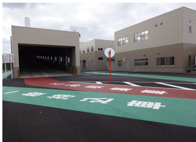
計量棟通過後の動線表示

ごみ持ち込みの際、市民の方にわかりやすいように構内の道路に一般車両と業者車両それぞれの動線表示をしました。