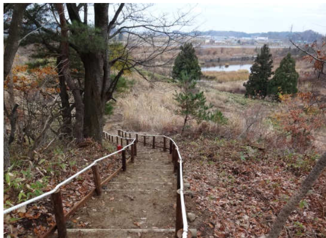
遊歩道 南側出入口