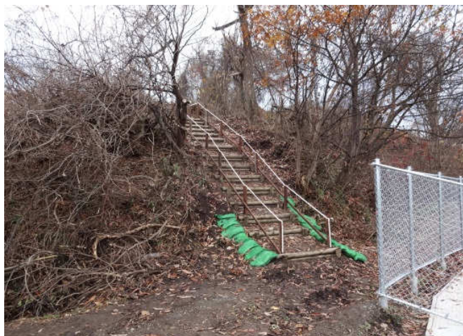
遊歩道 北側出入口

外構工事の一環として、処理施設敷地の東側に隣接する小高い丘の峰沿いに、遊歩道を設置しました。