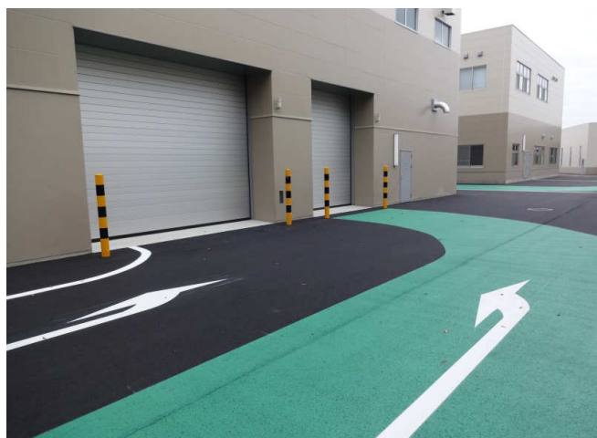
リサイクルセンター入口の表示

「クリーンプラザよこて建設工事だより」は、栄地区の皆さんにお届けするほか、栄公民館、各地域局にも置いています。また、市ホームページにも掲載していますので併せてご覧ください。