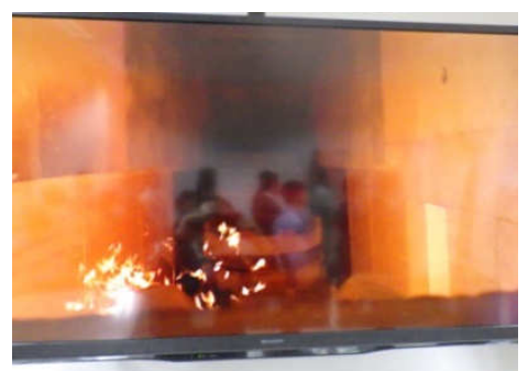
焼却炉燃焼のようす