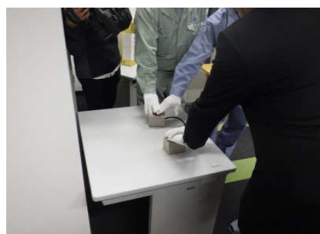
焼却炉点火のようす