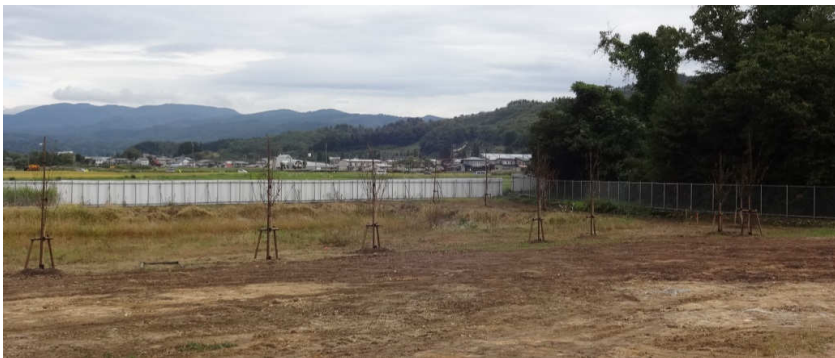
桜の植樹の様子（施設北側・防災調整池付近）

熱回収施設、管理棟、リサイクルセンター、雪室、洗車場、計量棟など付属棟も、外壁貼り付け工事が完了しております。足場が外され、施設の外觀がみてとれるようになりました。現在は内装の施工中です。施設工事の他に外構工事（植栽、立入防止柵組立、道路舗装など）が順次行われています。