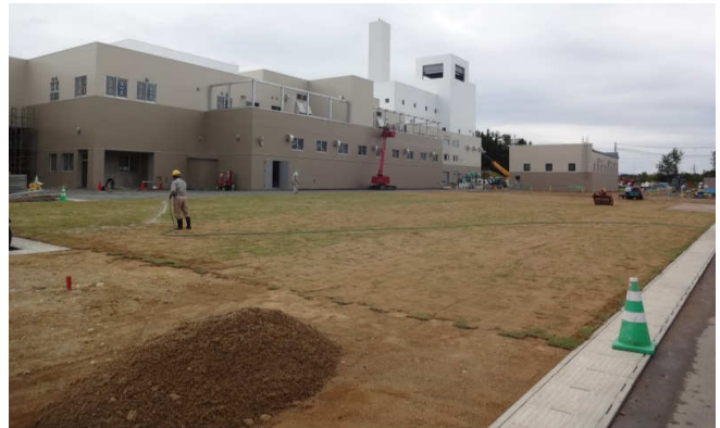
芝生張りの様子（リサイクルセンター西側）