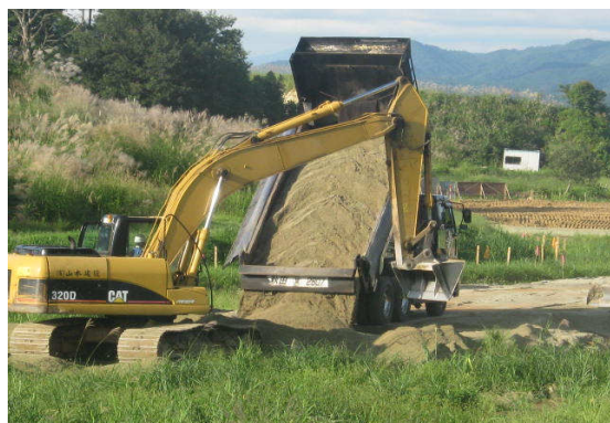
リサイクル砂搬入状況

この砂はエコマーク商品として認定されており、砂よりも低コストで水はけもよく、ダイオキシンや重金属等による土壌汚染の環境基準も満たしている安心・安全なリサイクル砂です。