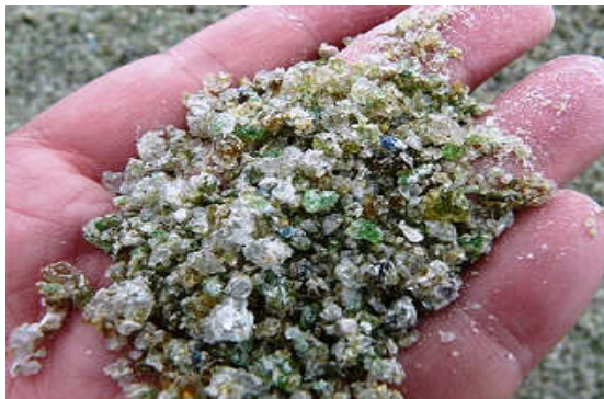
色付きガラスを利用したリサイクル砂

用地の一部の一般的に軟弱地盤とされる水田があった場所において、搬入路等ができる部分を補強するため、これまで廃棄・埋立処分されていた色付きガラスをリサイクルし粒状に加工したものを砂の代わりに敷設しています。