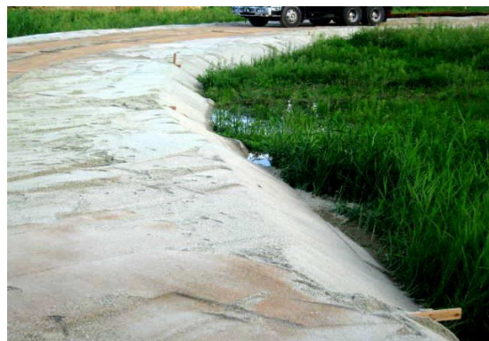
リサイクル砂敷きならし後

環境にやさしくエコな施設となるクリーンプラザよこての地盤の補強に貢献しています。