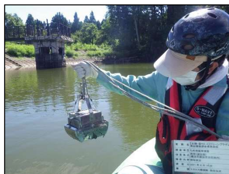
採取状況(荒沼(流出側))