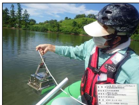
採取状況(荒沼(流入側))