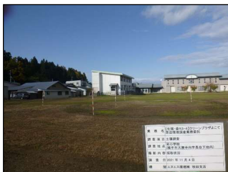
全景(栄小学校グラウンド)