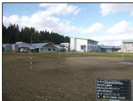
全景(栄小学校グラウンド)