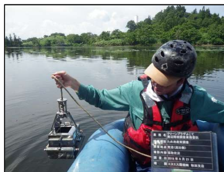
採取状況(荒沼(流出側))