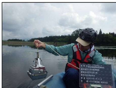
採取状況(荒沼(流入側))