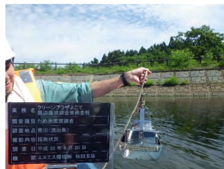
採取状況(荒沼(流出側))