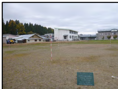
全景(栄小学校グラウンド)