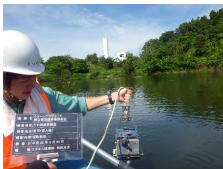
採取状況(荒沼(流入側))