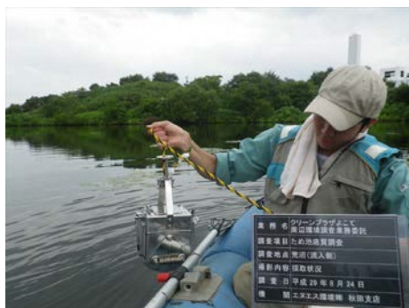
採取状況(荒沼(流入側))