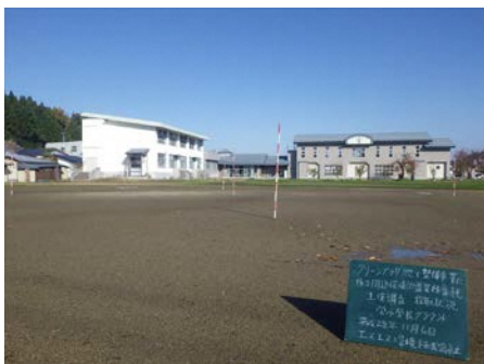
全景(栄小学校グラウンド)