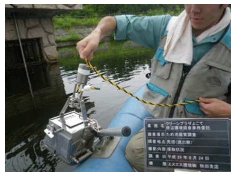
採取状況(荒沼(流出側))