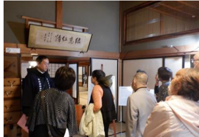
渋沢栄一直筆の書に見入る参加者