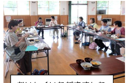
おいしくいただきました