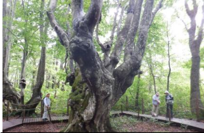
あがりこ大王の幹の太さに感激でした