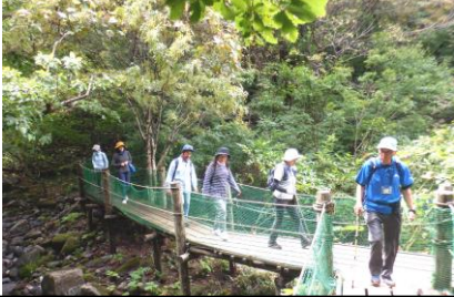
整備された木道で歩きやすかったです

9月7日、わくわくハイキング～パワースポット・森の巨人あがりこ大王を見に行こう～を開催しました。当日は、天候にも恵まれ絶好のハイキング日和でした。15人が参加し、珍しい草や木の実や木々などガイドの2人から教わりながら、ゆっくりハイキングを楽しみました。目的地の『あがりこ大王』はとても大きく神秘的な空間が漂っていて、樹齢300年以上の生命のパワーをいただてきました。ハイキングの後は、道の駅象潟「ねむの丘」に立ち寄り、海辺を散策したり温泉に入ったりして心身ともにリフレッシュできました。