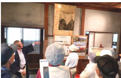
ガイドの説明に真剣にメモを取っている方も見られました

10月8日、大雄芸術文化協会と大雄地区交流センター運営協議会の共催事業の【芸術文化に触れる研修～国登録有形文化財「旧本郷家住宅」ガイドツアー～】を開催しました。23人が参加し、大仙市角間川町の旧本郷家や隣接されている旧北島家・旧荒川家の当時の文化や歴史について学びました。参加者からは「日本庭園が素晴らしく、地域の文化財として大切にしていきたい」「近くに住んでいながら行けなくて今回参加できて良かった」などの声が聞かれ、地元の豊かな文化に触れることのできた貴重な一日となりました。