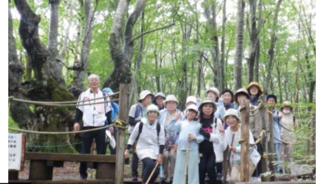
みんなでにっこり集合写真