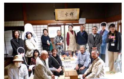
藤井聡太氏 竜王戦が予定されていた場所で記念撮影