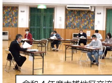
令和4年度大雄地区交流センター運営協議会総会