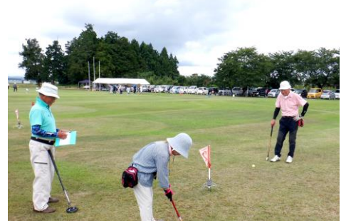
集中して最後の一打を狙います