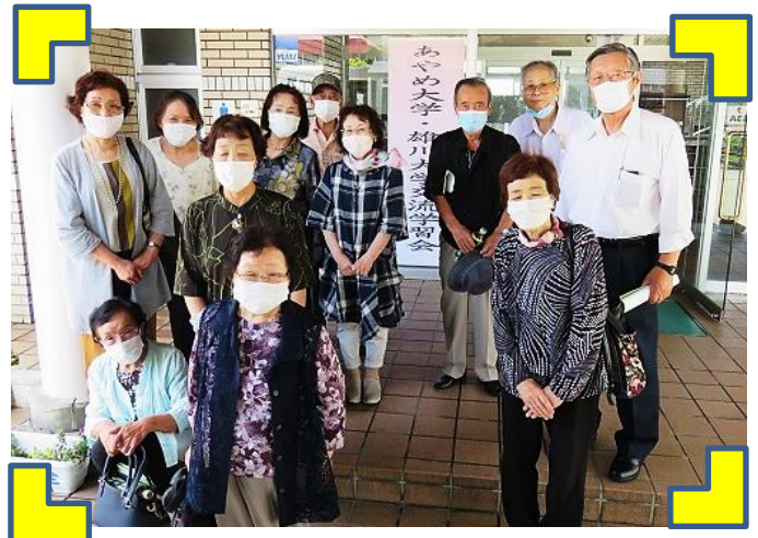
参加した雄川大学の皆さん