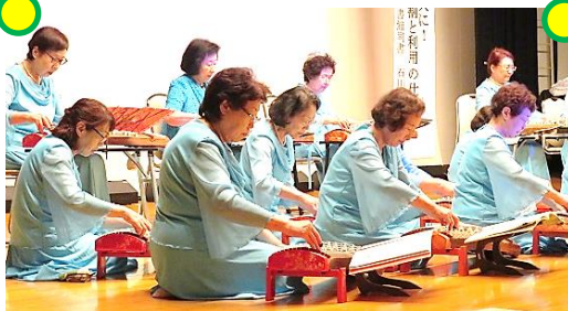
文化箏浅舞教室の皆さん