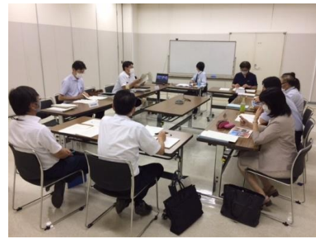
【会議】市民会館部会