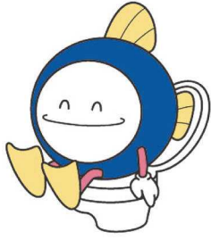
下水道イメージキャラクター・スイスイくん