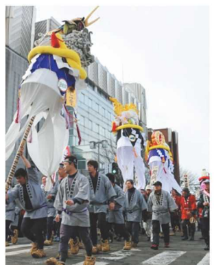
旭岡山神社の梵天(2月16日～17日)【横手】