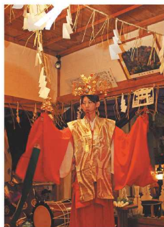
保呂羽山の霜月神楽 (11月7日～8日)