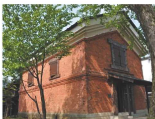
赤川家住宅蔵【大森】