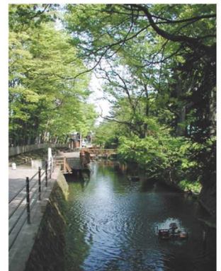
イバラトミヨ生息地(琵琶沼)【平鹿】