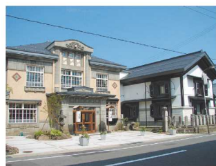
平源旅館本店【横手】