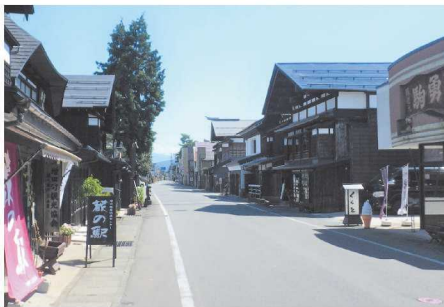
横手市増田伝統的建造物群保存地区