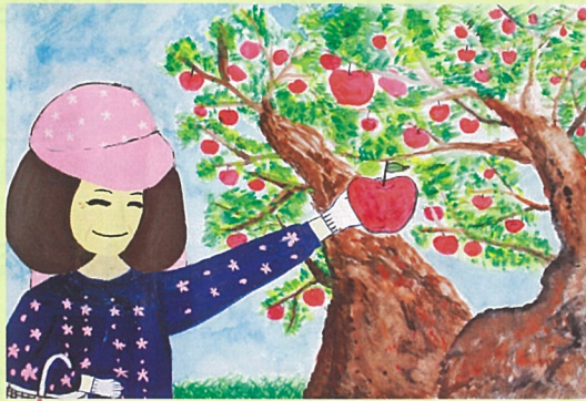
真っ赤なりんごとれたよ